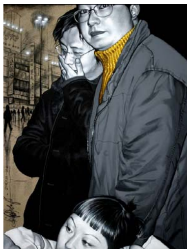
鐘颯／ジョン・ピャオ 《今夜はどこへ?》 2004年