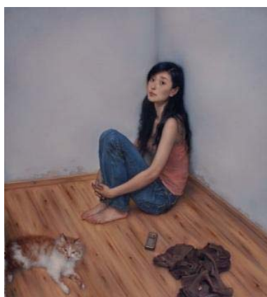
龐茂琨／パン・マオクン 《長い夏の日》 2008年