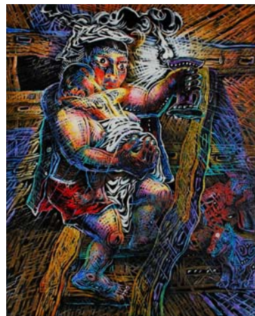
羅中立／ルオ・ジョンリー 《梯子を下りる農婦》 ※予定

※ジャン・シャオガンの代表のひとつ。2007年サザビーズオークションで約1億円で売却された「大家族」のシリーズ作品。