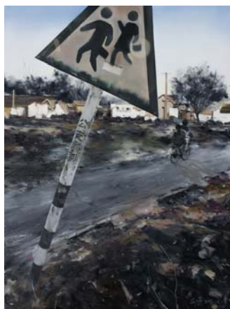
馬文婷（マー・ウェンティン）《即景 NO. 6》 2008年