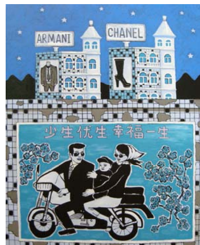
陳衛閩／チェン・ウェイミン 《帰郷》 2009年