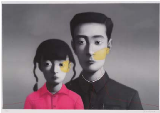
張曉剛／ジャン・シャオガン 《2007-大家族》 2007年

※ジャン・シャオガンの代表のひとつ。2007年サザビーズオークションで約1億円で売却された「大家族」のシリーズ作品。