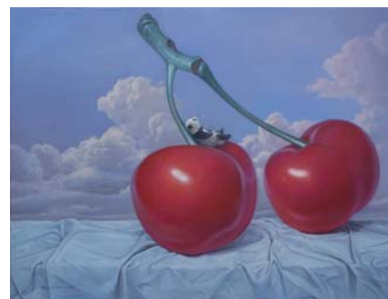
張奇開（ジャン・チーカイ） 《嫌食主義者宣言 NO. 1》 2009年