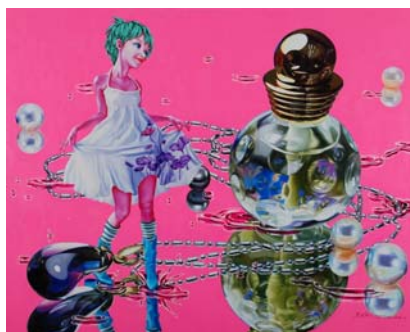
熊莉鈞（ジョン・リージュン） 《リトルプリンセス》 2008年