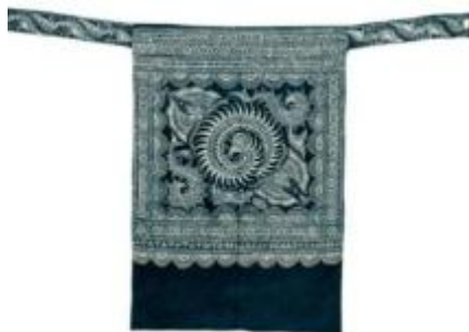
龍蝶鳥紋子守帯 316×32cm 貴州榕江 ミャオ族