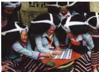
貴州六枝梭嘎地域 ミャオ族 女性達が集まり蠟で図柄を描く様子

主 催：日中友好会館、国立中国美術館 後 援：中華人民共和国駐日本国大使館、 (社)日中友好協会、日本国際貿易促進協会、 日本中国文化交流協会、日中友好議員連盟、 (財)日中経済協会、(社)日中協会、日本華僑 華人聯合總會、東京中国文化センター