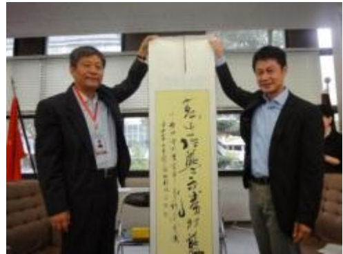
湯崎広島県知事(右)を表敬訪問

代表团は、東京でテーマごとの交流を行った後、広島へ移動した。9月16日午前には、湯崎英彦広島県知事を表敬訪問し、湯崎知事より、原爆が投下され大きな被害を受けた広島が、どのように復興を成し遂げたかについてお話を聞いた。午後には広島大学を訪問し、浅原利正学長をはじめ、大学院社会科学部法政システム専攻を中心とする研究者、大学院生らに迎えられ、学術交流会に参加した。終了後は、引き続き夕食交流会が行われ、日中双方計約90名が食事をしながら自由に懇談し、賑やかな交流となった。