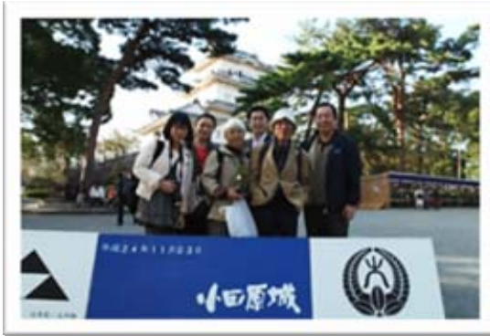
小田原城の広場にて

小田原から東京に帰ってきて、いつもの1週間が始まり、忙しい研究生活に戻りましたが、今は心の中から以前とは違う積極的な力が湧いてくるのを感じることができます。