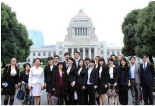
国会議事堂前にて

10月18日、東京は天高くさわやかな季節を迎えているところだ。我々後楽寮生の20人と中国留学生学友会を通じて集まった都内各大学の中国留学生25人は国会議事堂を見学して来た。